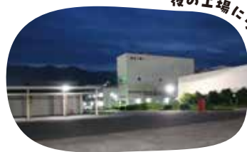
夜の工場にウケウケ!