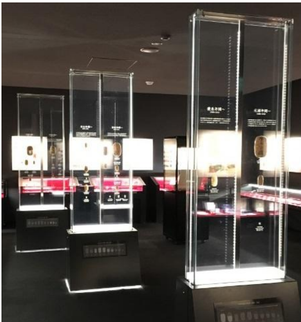
《アクリルタワーケースによる展示》

大判小判の表裏を見ることができるアクリルタワーケースで展示しております。江戸時代の息吹を感じてください。時価数千万円のお宝も！