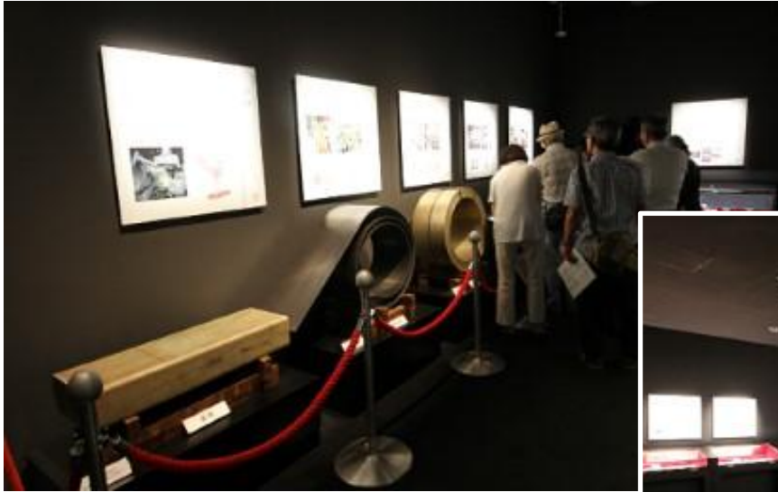
《 博物館見学の様子 》