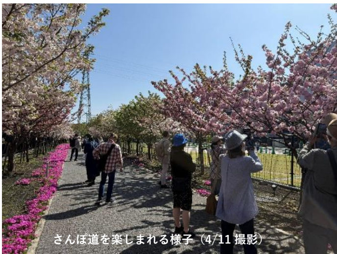
さんぽ道を楽しまれる様子 (4/11 撮影)

今年は全国的に桜の開花が早く、開催前に既に満開の品種もありましたが、八重桜を中心とした26品種107本が順次開花し、遅咲き品種も期間中に満開を迎え、最終日まで多くの方にお楽しみいただきました。