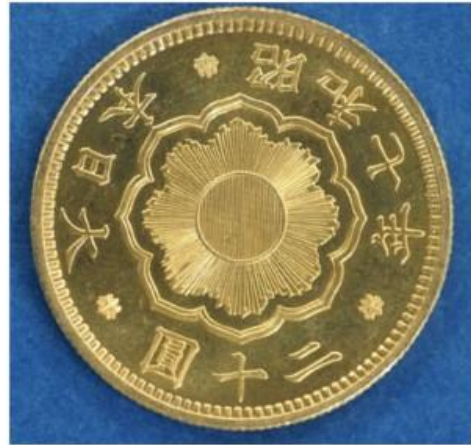
《昭和7年銘20円金貨幣》

昭和7年銘の金貨は、金本位制最後の金貨。 希少価値が高く、幻の金貨とされています。