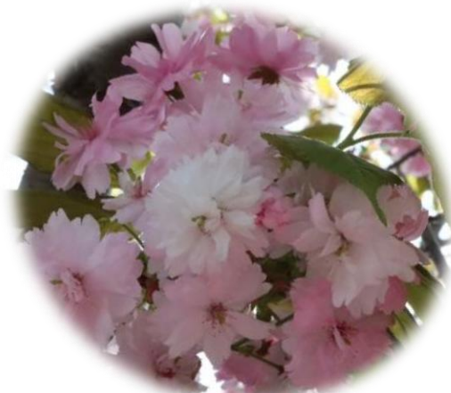
遅咲きの「奈良八重桜 (ならやえざくら)」 4/15、4/16 満開 (4/17 撮影)