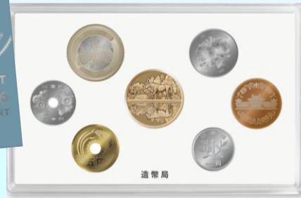
《令和8年銘ミントセット》 【販売価格：2,300円（税込）】