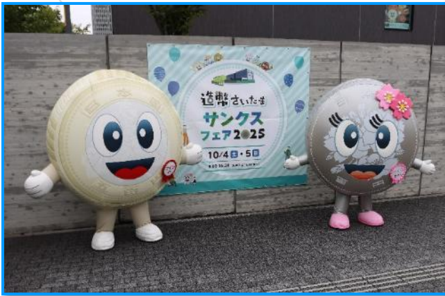
コインくん、さくらちゃんがお出迎え！

令和7年10月4日（土）、5日（日）の2日間、日頃から造幣局の事業にご理解をいただいている地域の皆様感謝の意を込めて、『造幣さいたまサックスフェア2025』を開催しました。今回も『休日工場見学』をメインに、子供向けのミニ講座『キッズアカデミー』と体験型イベントとして『クイズラリー』を開催し、2日間で2,755人の方々にご来場いただきました。