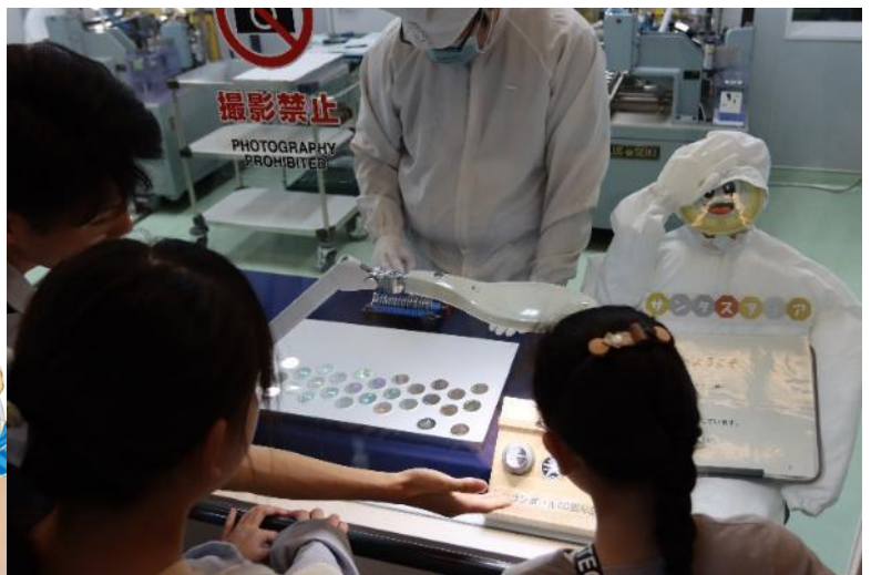
プルーフ貨幣工場の様子