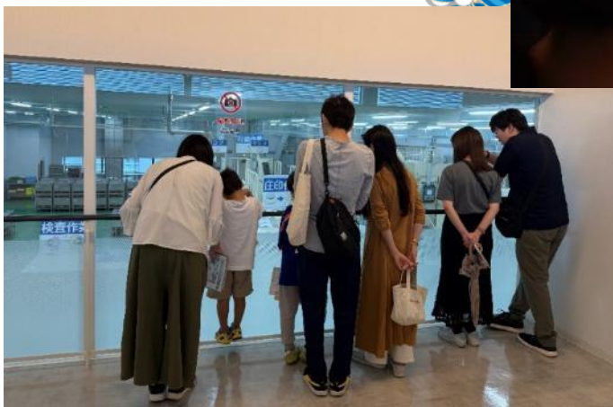
通常貨幣工場の様子