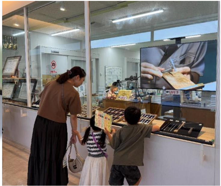
勲章を作っている匠の技は必見！