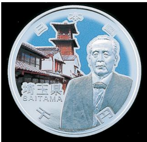
《 地方自治法施行60周年記念千円銀貨幣プルーフ貨幣セット(埼玉県) 》

また、過去には埼玉ゆかりの記念貨幣も発行されています。 是非一度ご覧になってください。