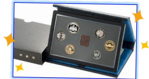
通常プルーフ貨幣セット〔年銘板(有)〕