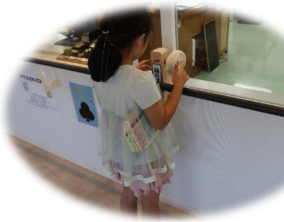
研磨作業に使用している羽布(バフ)に触れる体験も ※こちらは常設展示しています。

現代の名工等の卓越した技能や奥にある作業室で行われている業務を見ることができるよう、手元カメラを増設して見学通路側に設置したライブカメラで上映しました。