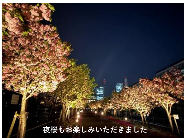
夜桜もお楽しみいただきました