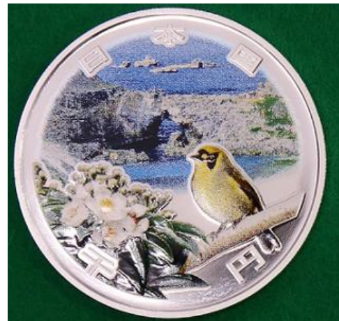
《 さいたま支局で打初め式を行った「小笠原諸島復帰 50 周年記念千円銀貨幣」 》