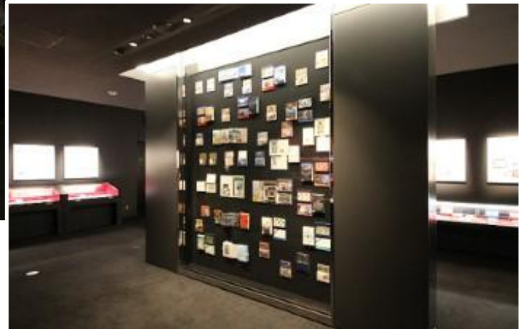
《 壁面ラックで貨幣セットを展示 》