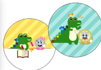
♪当日の缶バッジのデザイン