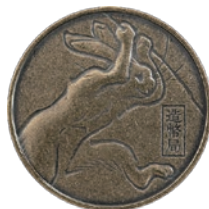
鳥獣人物戯画(甲巻)より「猿追いの兎」