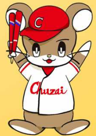
中国財務局マスコットキャラクター ざいちゅう

小学生とその保護者 (新年度から小学4年生~6年生) ※対象学年以外のお子様の同伴はできません。 ※保護者1名につき、小学生3名以内でお申込みください。