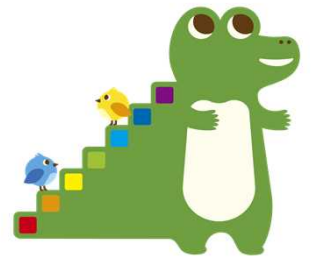
つみたてNISAキャラクター つみたてワニーサ