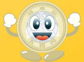
造幣局マスコットキャラクター コインくん

※ご提供頂いた個人情報は、参加者への案内・運営のために利用し、ご本人の承諾なしにいかなる第三者にも開示・提供することはありません(新型コロナウイルス感染症に関する公的機関からの要請を除く)。