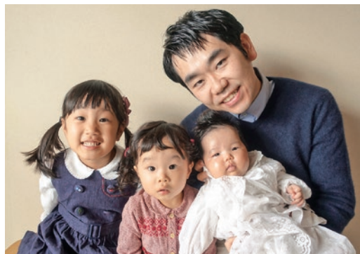
事業部 事業企画課 主事 平成 25 年採用 総合職 (工学)

1か月間の「男性育児休業」では、第3子の新生児期という二度とない貴重な時間を一緒に過ごせたことがかけがえのない思い出になりました。また、上の2人の子達ともこれまで以上にじっくり時間をかけて触れ合えたので家族の絆が深まったと思います。