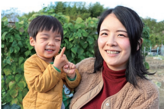
貨幣部 管理環境課 主任 平成 27 年採用 総合職 (工学)