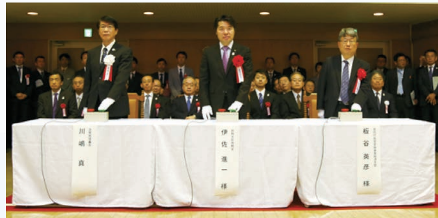
（中央）伊佐 進一 様：財務大臣政務官 （右側）板谷 英彦 様：宮内庁長官官房皇室経済主管

平成 30 年 11 月 5 日（月）に関係者の方々をお招きして、記念貨幣の打初め式を行いました。