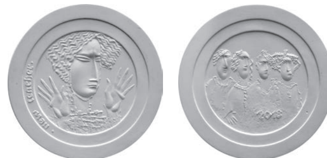
タイトル：「Memories of schooldays.」 (学校時代の記憶) 作 者：Oleg Gavrizon (イスラエル)

造幣局では、一般部門の最優秀賞受賞作品をメダルにした「ICDC2018メダル」の販売を予定しており、詳細は、4月下旬頃にホームページでお知らせする予定です。6