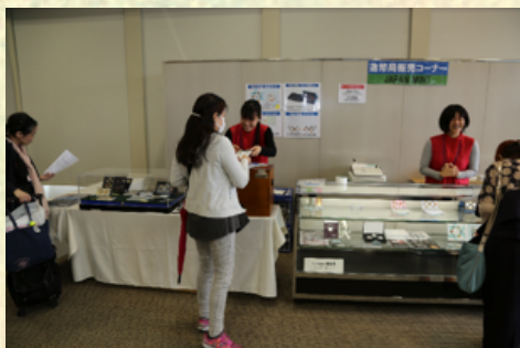
造幣局販売コーナー