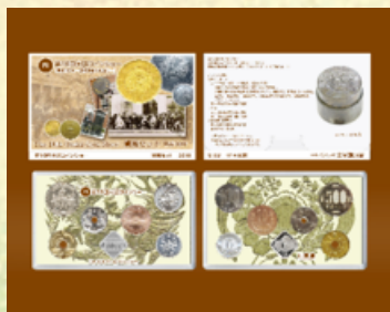
会場で販売した貨幣セット