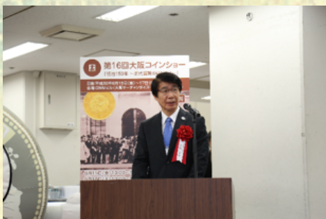
来賓挨拶(造幣局理事長)