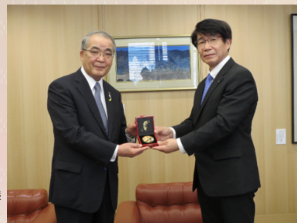
平成 30 年 7 月 12 日 (木) (左側) 長崎県知事 中村 法道 様 (長崎県庁)