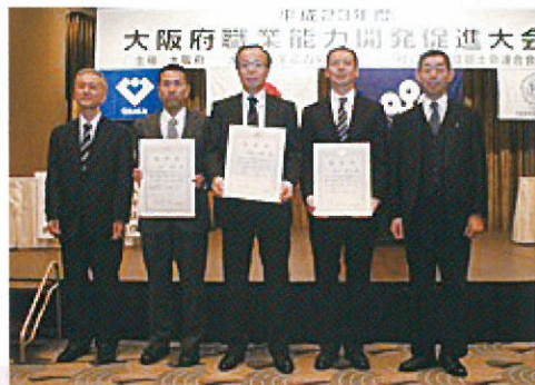
大阪府優秀技能者表彰(なにわの名工) 3名

極めて優秀な技能を有している技能者として、各地域において造幣局職員が表彰されました。