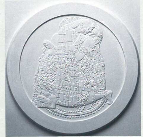
(最優秀賞受賞作品の石膏原版)

国際コイン・デザイン・コンペティション2011には、一般部門に16か国から127作品の応募をいただきました。