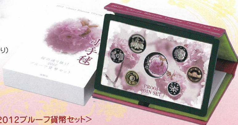
<今年の花>小手毬(こでまり)

桜だよりが聞かれる今日このごろ、まもなく、春の風物詩となっている造幣局の「桜の通り抜け」、広島支局の「花のまわりみち」の季節を迎えます。今年の桜の通り抜けでは129品種・354本、花のまわりみちでは57品種・22本の桜が皆様のご来場をお待ちしています。造幣局では、桜の花に親しみをもっといただくため、毎年、一種を「今年の花」として紹介しています。