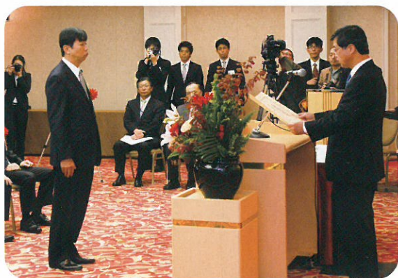
第24回人事院総裁賞に、造幣局職員が選ばれました。