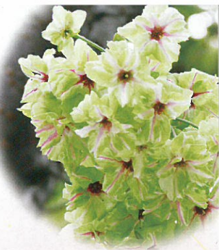
<今年の花>御衣黄(ぎょいこう)