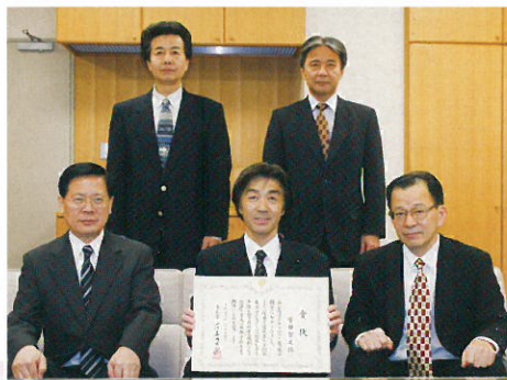
東京都優秀技能者(東京マイスター)知事賞1名